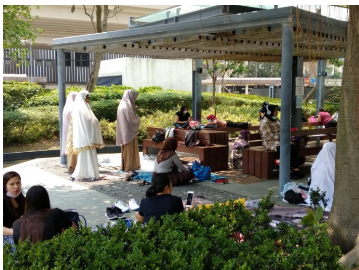
齋戒月在公園拜禱