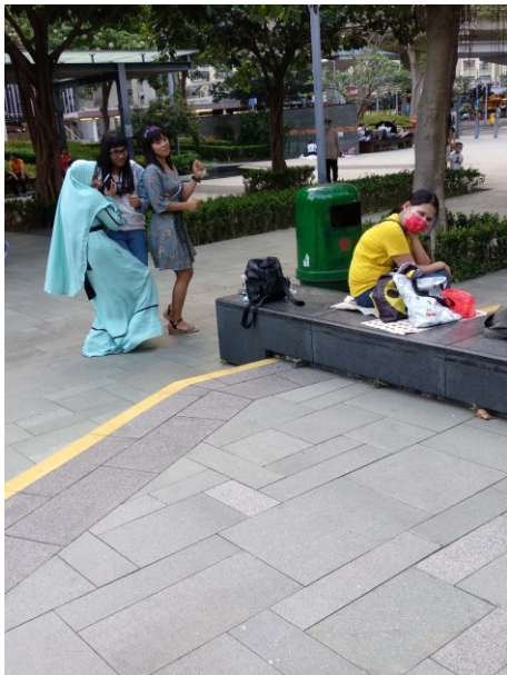
穿著整齊年青印僑與友人跳現代舞