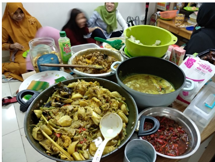
開齋節印尼牧師宿舍開放慶祝