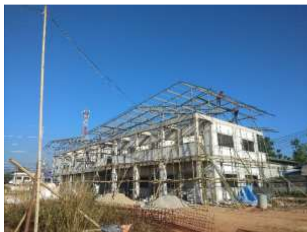
男生宿舍屋頂設計如展開的翅膀