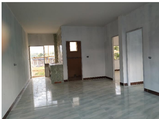
女生宿舍的同工單位