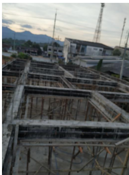
男生宿舍二樓工程