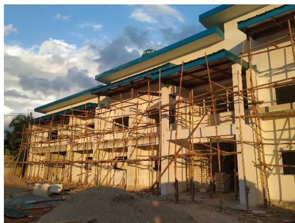
女生宿舍將開始油漆工程