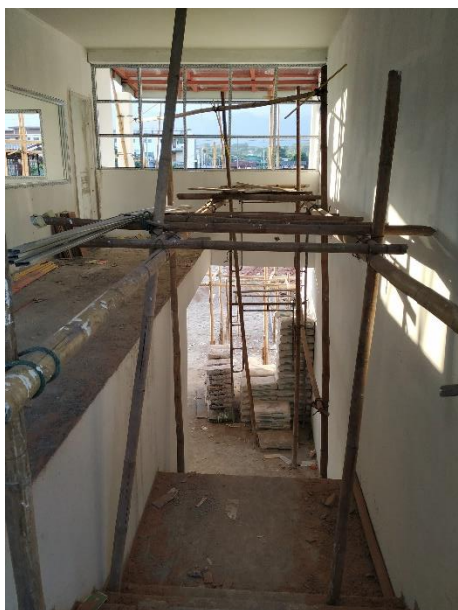
女生宿舍室內樓梯