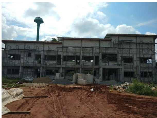
郭誠女生宿舍正面