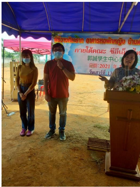
介紹承建工程負責人之一