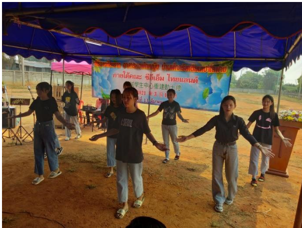
高中女生跳讚美操