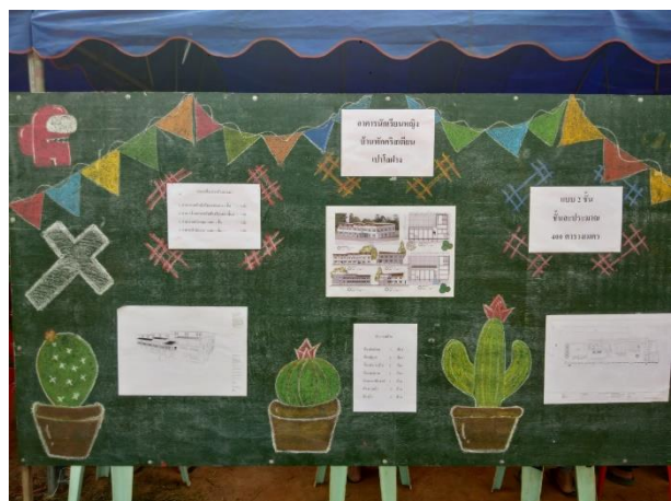
建築工程介紹壁佈板