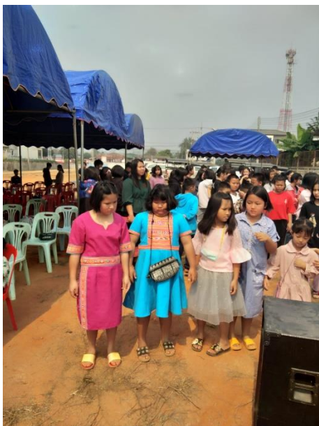
郭誠學生中心學生一同見證