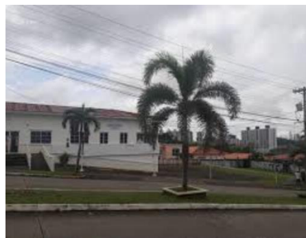
剛購下準備做社區中心的物業