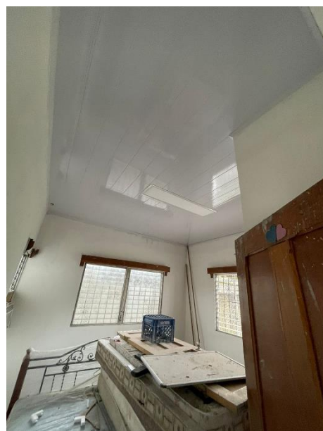
牛口省教會裝修工程

感謝各教會的同工及肢體對我們一家的關心及支持，求神記念並親自賜福給你們，使眾教會興旺。