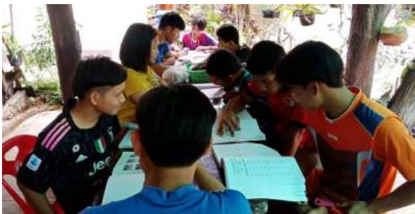
大哥哥教小弟弟計劃