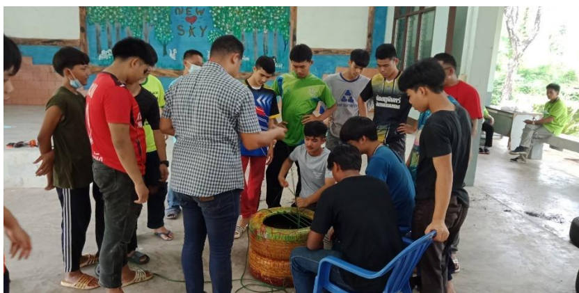
上課情況：用輪胎做繩座