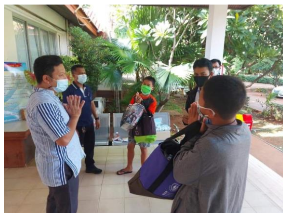
觀護所所長為兩位兄弟祝福