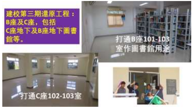
第三期 B 座及 C 座還原工程

新天聖經學院行政委員會：朱昌銓博士（院長）、李光平博士（教務主任）、李彭艷桃師母（行政主任）、林翠霞牧師（院董、泰國工場主任）敬上