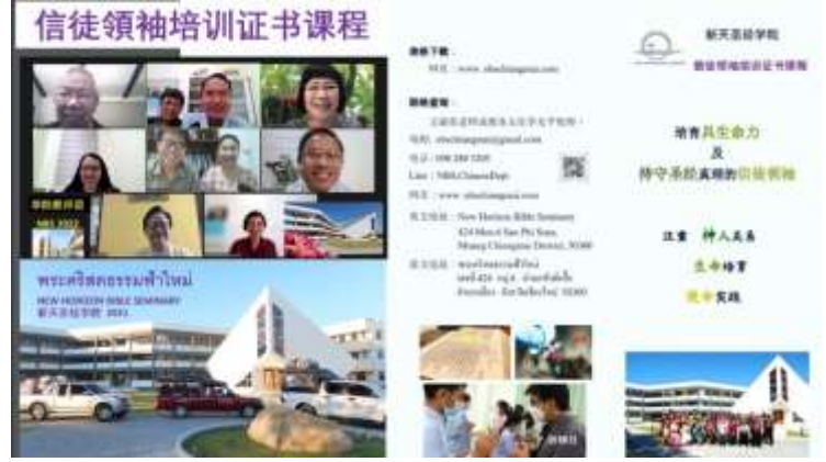
華文神學訓練——信徒領袖培訓證書課程