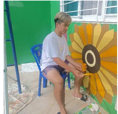
短宣隊為郭誠學生中心畫壁畫

謝謝您們的關心、禱告、奉獻支持，願神賞賜各樣福氣給您們，叫您們身體靈魂同得興盛。