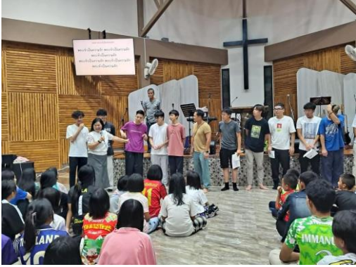
短宣隊負責郭誠學生中心晚會