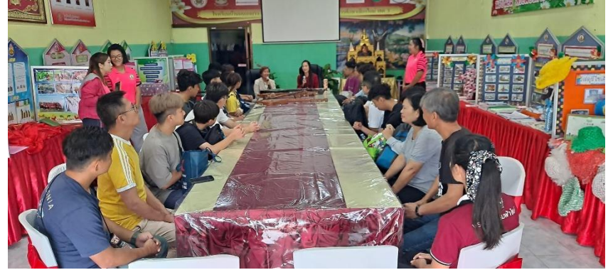
短宣隊作小學英文義教