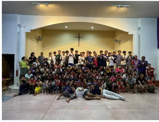
短宣隊負責新天之家晚會