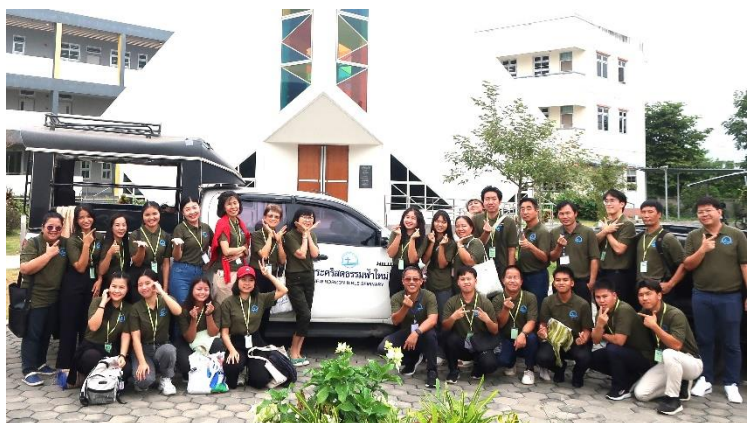
聖誕學生佈道隊出發