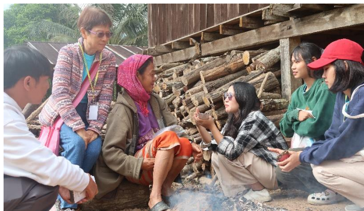
李師母帶領學生佈道