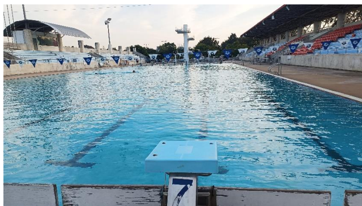
李牧師游泳的國際標準泳池