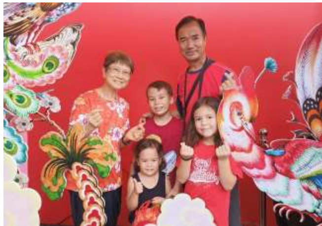
往曼谷探望女兒一家