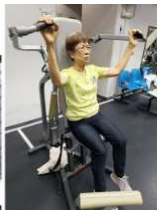
注意飲食，身體健康