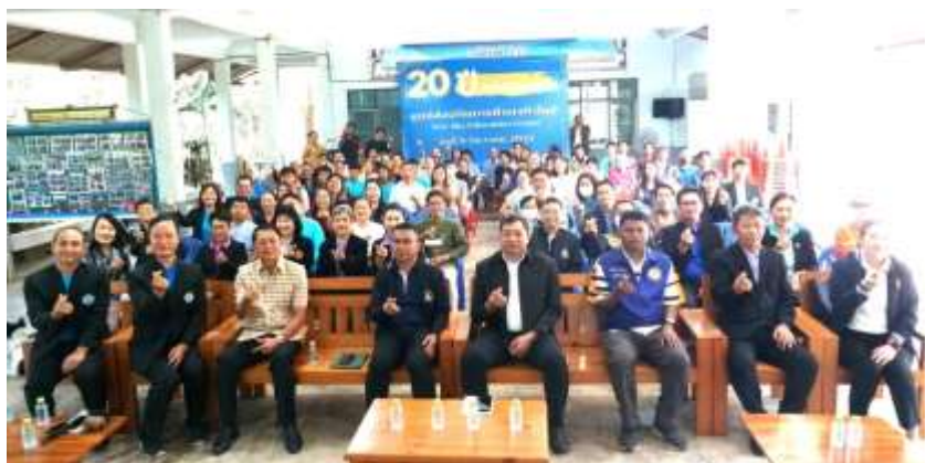
騰縣教育中心慶祝成立 20 周年