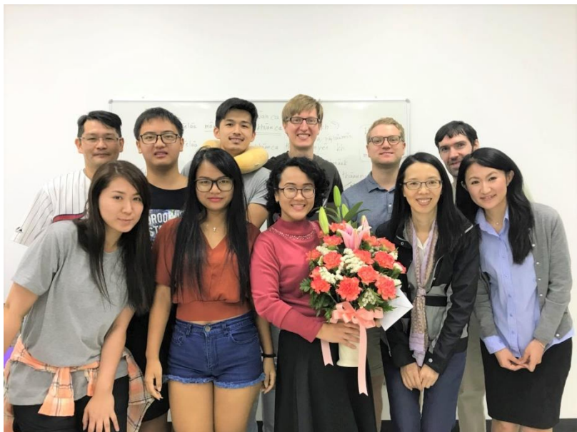
泰文會話班(一)合照