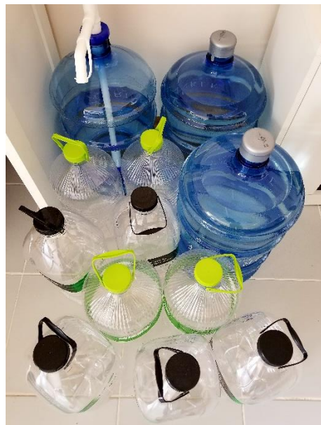
購買的食水和水樽