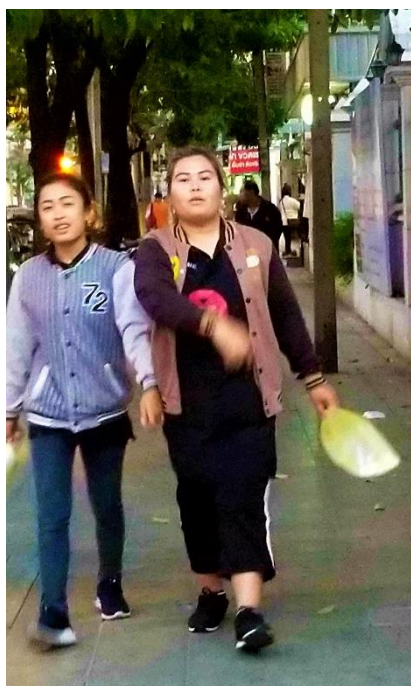
冬日 15-26 度氣溫的衣著