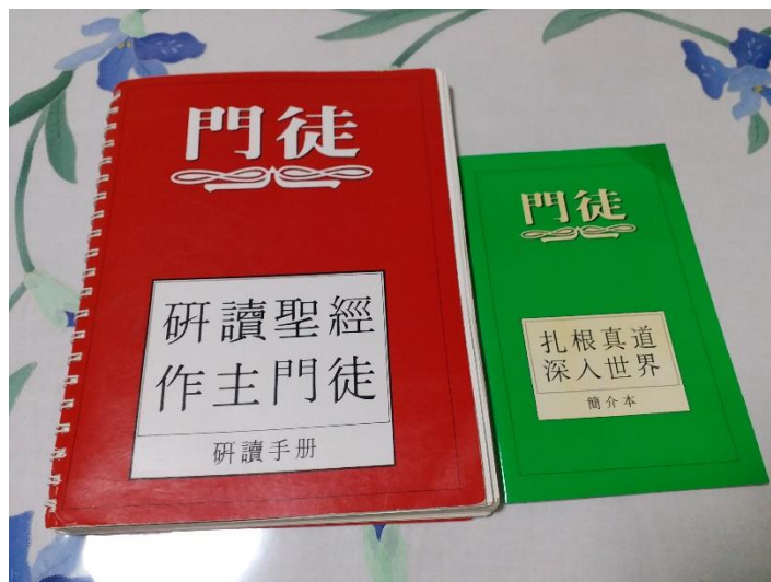
「研讀聖經，作主門徒」門訓課程